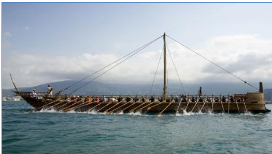
De Argo, het mythologische schip

Toch is dit alles niet voldoende als onze leerlingen niet zelf de riemen bemannen. Zij zijn degenen die de boot moeten bewegen, zij zijn zelf de motor van hun tocht.